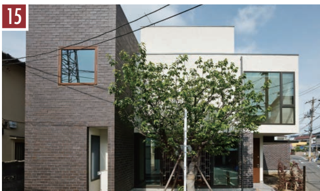
15 | レンガ：スレートブラック | 目地：ダークグレー |