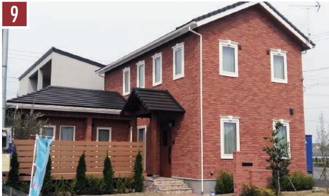
9 | レンガ：ワレゴ | 目地：ブラウン |