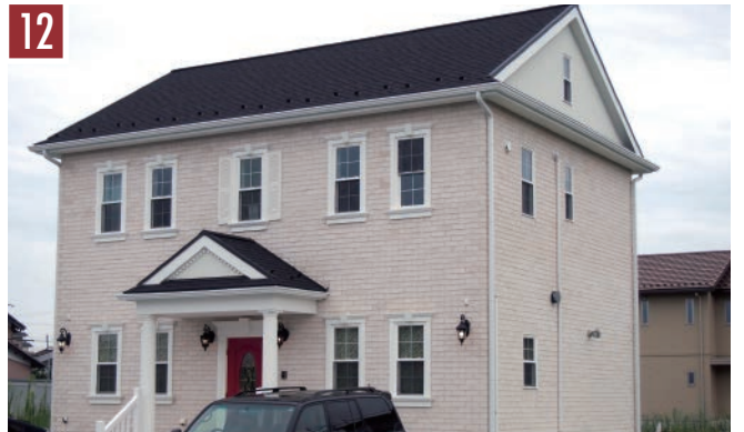
12 | レンガ：ポーラーホワイト | 目地：オフホワイト |