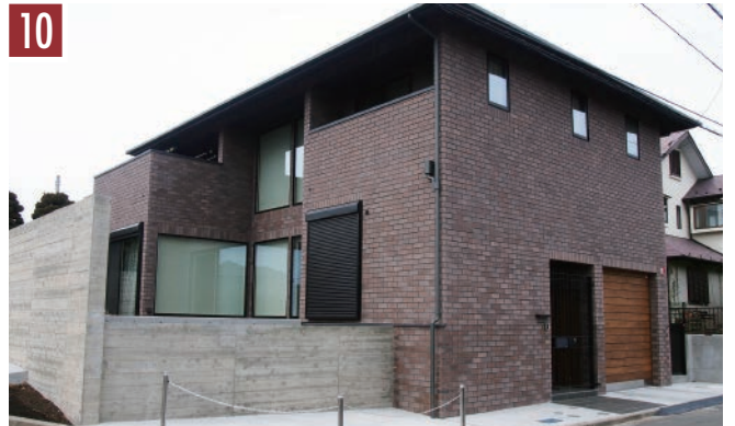
10 | レンガ：ペッパー | 目地：ダークグレー |