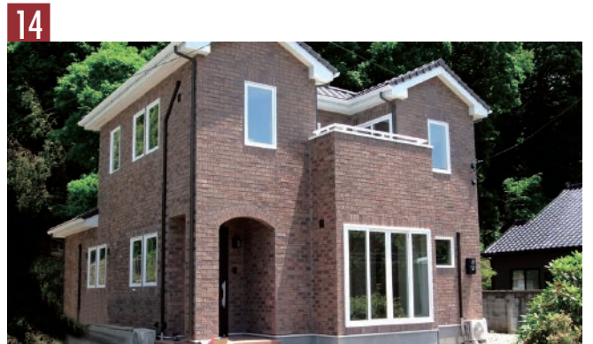
14 | レンガ：コラン | 目地：ダークグレー |