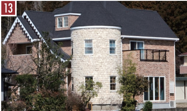
13 | レンガ：ノーフォーク/コッツウォルズストーン | 目地：オフホワイト |