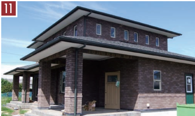
11 | レンガ：ペッパー | 目地：ダークグレー |